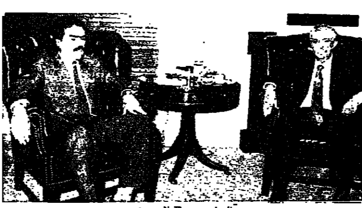
الهراوي مستقبلا رحمة

عند الخامسة والنصف استقبلت السيدة منى الهراوي عائلات اعضاء الوفد البريطاني في زيارة برتوكولية. وعند السادسة والنصف استقبل الرئيس السيد الهراوي الوفد البريطاني وعرض معه التطورات الراهنة على السلطة اللبنانية. وما يمكن لبريطانيا ان تساعده به سياسيا لمنع عجلة السلام في لبنان الى الامام واستمر الاجتماع لغاية الساعة والنصف قال بعده النائب ادلي: ان الرئيس الهراوي في مركز صعب وحساس ويحتاج ان دعم كل من فيه بلده لكي يحقق اهدافه. □ وعن هدف زيارة الوفد الى لبنان قال: جئنا لتؤكد دعماً للحكومة اللبنانية والرئيس الهراوي وللإطلاع على الوضع عن قرب ونفهم هذا الوضع. □ وسئل عن رايه بالوضع في لبنان فقال: اعتقد ان اتفاق الطائف يشكل مخرجا مهما ويجب ان تتضافر الجهود ويعتبرون الجميع والعمل من خلال اتفاق الطائف لتحقيق السلام في لبنان.